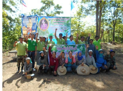
ต้อนรับคณะผู้นำชุมชนจากประเทศเวียดนามมาดูงาน