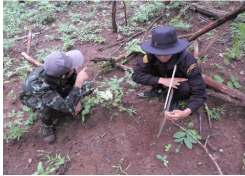
ภาพการตรวจวัดการพังทลายของดิน ในพื้นที่สวนป่าแม่จาง

จากการตรวจสอบติดตามการพังทลายของดิน ตามสถานีตรวจวัดการพังทลายของดินในพื้นที่สวนป่าแม่จาง แปลงปี 2523 และ 2524 ในการตรวจสอบติดตามพบว่าค่าการพังทลายของดินในพื้นที่ของสวนป่าฯ อยู่ในระดับที่น้อยมาก ซึ่งไม่ก่อให้เกิดผลกระทบต่อทรัพยากรทางธรรมชาติ และทรัพยากรที่เป็นปัจจัยสำคัญในการดำเนินชีวิตประจำวันของชุมชนรอบพื้นที่สวนป่า เช่น ทรัพยากรน้ำที่ใช้ในการอุปโภค บริโภค เป็นต้น