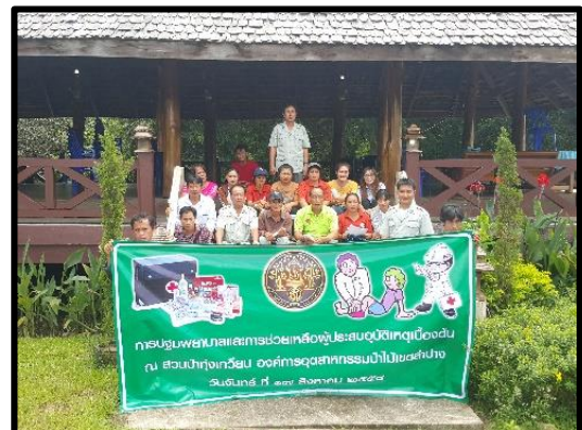
การอบรมปฐมพยาบาลเบื้องต้น