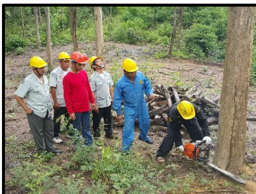
การอบรมเทคนิคการล้มไม้