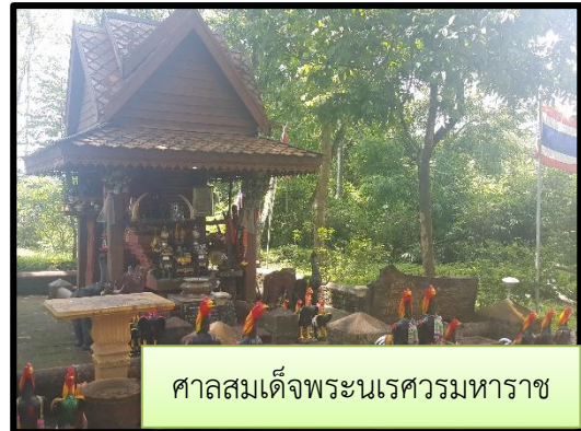
ศาลสมเด็จพระนเรศวรมหาราช