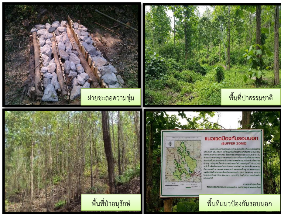
ฝายชะลอความชุ่ม