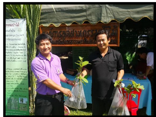
ร่วมจัดนิทรรศการกับชุมชนในโอกาสต่างๆ