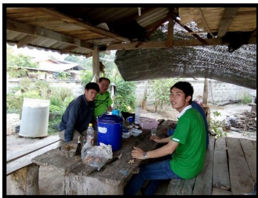
การเยี่ยมเยือนผู้นำท้องถิ่น