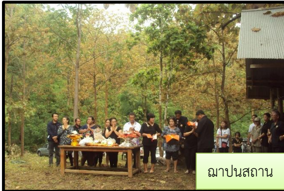
ฌาปนสถาน