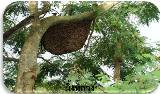
ผีเสื้อหลวง