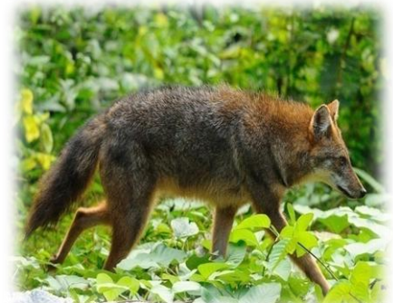
สุนัขจิ้งจอก

- ด้วงแมลง พบแมลงทั้งสิ้น 138 ชนิด แมลงที่มีประโยชน์สองกลุ่มที่พบในสวนป่าแม่จาง ได้แก่ กลุ่มแมลงกินได้ เช่น มดแดง แมลงกระซอน ผีเสื้อหลวง ผีเสื้อมี้ม ฯลฯ แมลงผสมเกสร เช่น ผีเสื้อ ชันโรง แมลงภู่ ฯลฯ โดยแมลงหลายชนิด เช่น ผีเสื้อกลางคืน ด้วง มีความสวยงามตามธรรมชาติและสามารถพบเห็นในสวนป่า