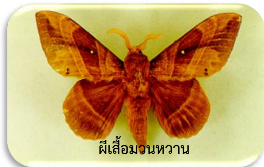
ผีเสื้อมวนหวาน

- ด้วงเห็ดขนาดใหญ่ พบเห็นทั้งในแปลงและนอกแปลงสำรวจทั้งสิ้น 25 ชนิด ซึ่งนับได้มีจำนวนชนิดเห็ดที่พบน้อย ในจำนวนนี้พบเห็ดที่สามารถนำมารับประทานได้ 4 ชนิด เช่น เห็ดแครง และเห็ดหูหนู ซึ่งนอกจากนี้ยังพบว่า เป็นเห็ดที่มีความชุกชุมมาก สามารถนำไปบริโภคและผลิตเห็ดเชิงเศรษฐกิจได้