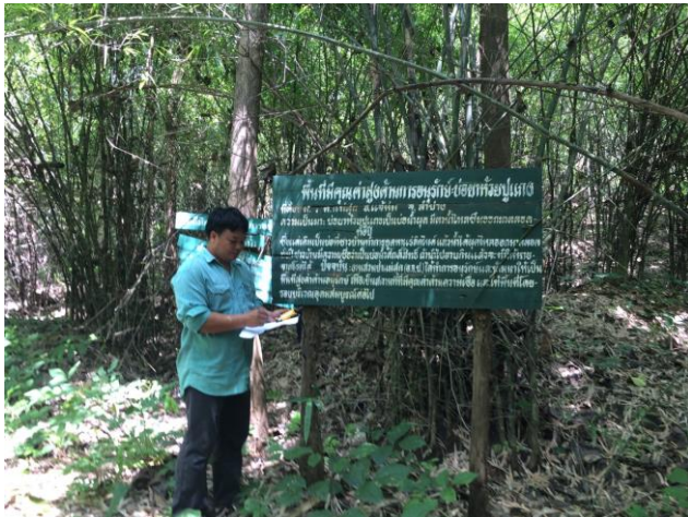
* ติดป้ายสื่อความหมายพื้นที่ที่มีคุณค่าด้านการอนุรักษ์และตรวจสอบติดตาม

ผลการตรวจติดตาม จากการสำรวจตรวจติดตามไม่พบความเสียหาย และผลกระทบจากการประกอบกิจกรรมของทางงานสวนป่าแม่สุก และจากปัจจัยภายนอก ต่อพื้นที่ที่มีคุณค่าด้านการอนุรักษ์ คือ บ่อยาห้วยปูแกง แต่อย่างไรก็ตาม มีแนวโน้มของไฟป่าในช่วงฤดูแล้ง งานสวนป่าฯจึงได้ทำการป้องกันไฟป่า โดยการทำแนวกันไฟ และตรวจตราป้องกันพื้นที่ดังกล่าวเพิ่มขึ้น