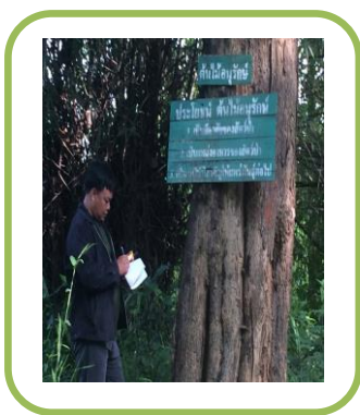
* ติดป้ายสื่อความหมายต้นไม้อนุรักษ์ และตรวจสอบติดตาม

การตรวจสอบติดตามด้านสิ่งแวดล้อม งานสวนป่าแม่สุกได้ทำการหมายแนวเขตพื้นที่ที่มีคุณค่าด้านการอนุรักษ์ ติดป้ายสื่อความหมาย และทำบันทึกการตรวจสอบติดตามสภาพของพื้นที่ที่มีคุณค่าด้านการอนุรักษ์ และงานสวนป่าฯ ได้กำหนดต้นไม้อนุรักษ์ พร้อมทั้งติดป้ายให้ทราบอย่างชัดเจน และทำการบันทึกดูแลตรวจสอบติดตาม