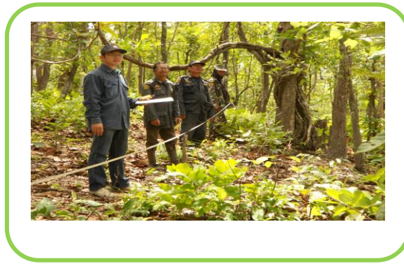
* การวางแผนสำรวจความหลากหลายของพืชและสัตว์และตรวจสอบ

หมายถึงคุณค่าของสิ่งมีชีวิต คุณค่าด้านนิเวศวิทยา คุณค่าด้านวัฒนธรรมและสังคม ที่ได้รับการพิจารณาว่ามีความโดดเด่นสำคัญมาก ทั้งในระดับนานาชาติ ระดับภูมิภาคหรือในระดับโลก ซึ่งคุณค่าเพื่อการอนุรักษ์อย่างสูงนี้ จำเป็น