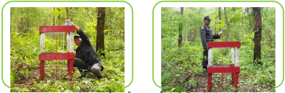
ภาพการตรวจวัดการพังทลายของดิน ในพื้นที่สวนป่าแม่สุก

จากการตรวจสอบติดตามการพังทลายของดิน ตามสถานีตรวจวัดการพังทลายของดินในพื้นที่สวนป่าแม่สุก แปลงปี 2521 และ 2530 ในการตรวจสอบติดตามพบว่าค่าการพังทลายของดินในพื้นที่ของสวนป่าฯ อยู่ในระดับที่น้อยมาก ซึ่งไม่ก่อให้เกิดผลกระทบต่อทรัพยากรทางธรรมชาติ และทรัพยากรที่เป็นปัจจัยสำคัญในการดำเนินชีวิตประจำวันของชุมชนรอบพื้นที่สวนป่า เช่น ทรัพยากรน้ำที่ใช้ในการอุปโภค บริโภค เป็นต้น