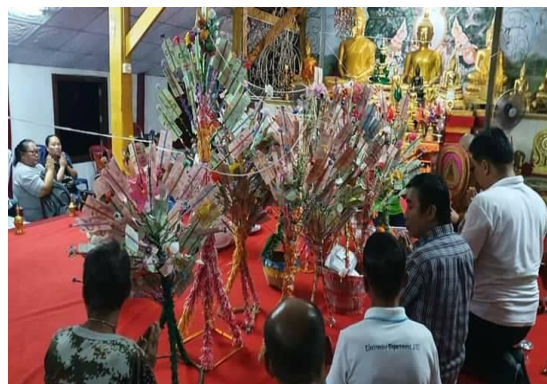
เข้าร่วมกิจกรรมงานผ้าป่าวัดสวนป่า บ้านป่าไม้ ต.แม่หพระ อ.แม่แตง จ.เชียงใหม่