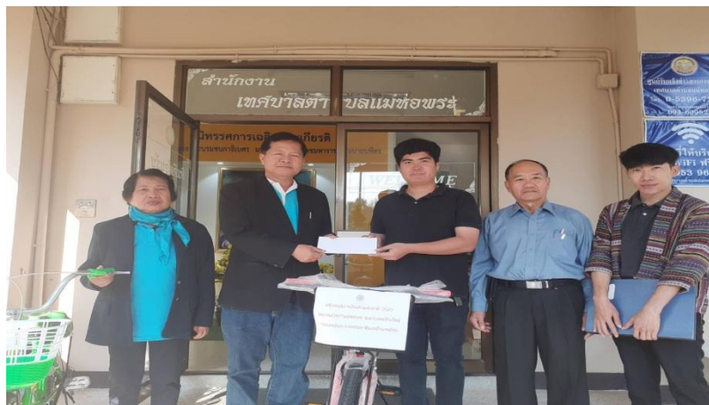
มอบจักรยานและทุนการศึกษา แก่เทศบาลตำบลแม่หอพระ เนื่องในกิจกรรมงานวันเด็กแห่งชาติประจำปี 2563