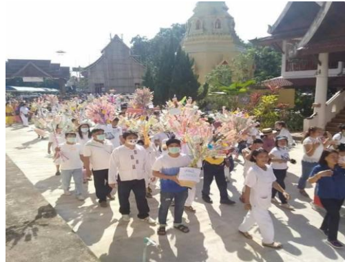
เข้าร่วมกิจกรรมงานกฐินวัดนาเมือง บ้านนาเมือง ต.แม่หพระ อ.แม่แตง จ.เชียงใหม่