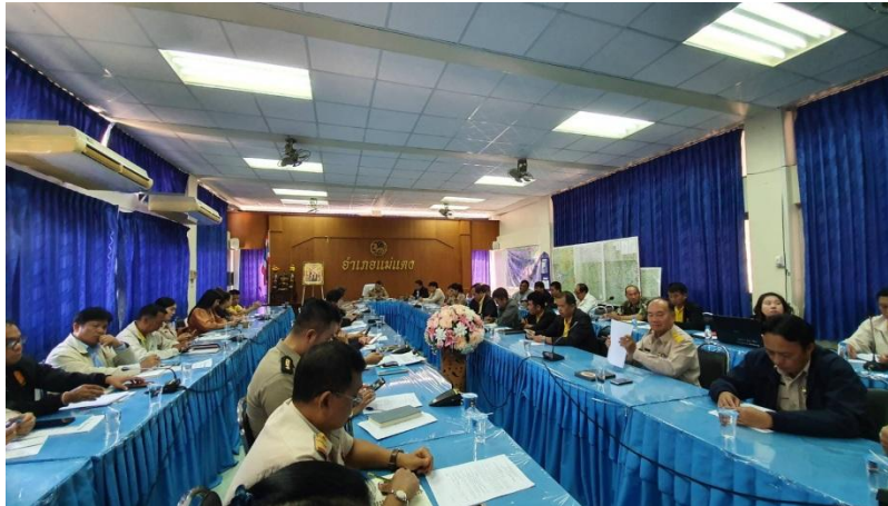
ประชุมอำเภอแม่แตง

[เอกสารเผยแพร่ การจัดการสวนป่าอย่างยั่งยืน งานสวนป่าแม่หอพระ]