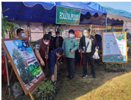
เข้าร่วมจัดนิทรรศการกิจกรรมงานวันของดีแม่หพระ ครั้งที่ ๖ ท้องที่ตำบลแม่หพระ