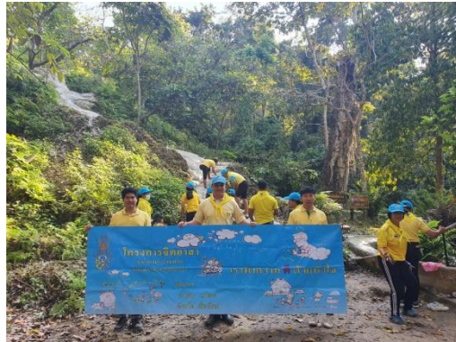
สวนป่าแม่หอพระเข้าร่วมโครงการกิจกรรมจิตอาสา “จิตอาสาพระราชทาน อำเภอแม่แตง ประจำปี ๒๕๖๓” โดยร่วมปรับปรุงภูมิทัศน์ ณ อุทยานแห่งชาติน้ำตกบัวตองน้ำพุเจ็ดสี อ.แม่แตง จ.เชียงใหม่