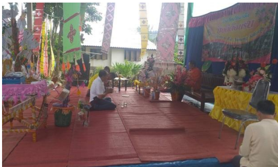
เข้าร่วมกิจกรรมงานผ้าป่าการศึกษาโรงเรียนบ้านผึ้ง บ้านผึ้ง ต.แม่หพระ อ.แม่แตง จ.เชียงใหม่