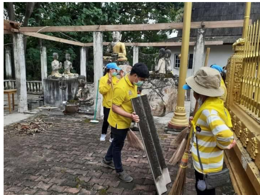
สวนป่าแม่หอพระเข้าร่วมโครงการกิจกรรมจิตอาสา “จิตอาสาพระราชทาน อำเภอแม่แตง ประจำปี ๒๕๖๓” โดยร่วมปรับปรุงภูมิทัศน์ ณ วัดพระธาตุนันทา อ.แม่แตง จ.เชียงใหม่