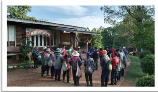
กลุ่มผู้รับเหมาแรงงานท้องถิ่น