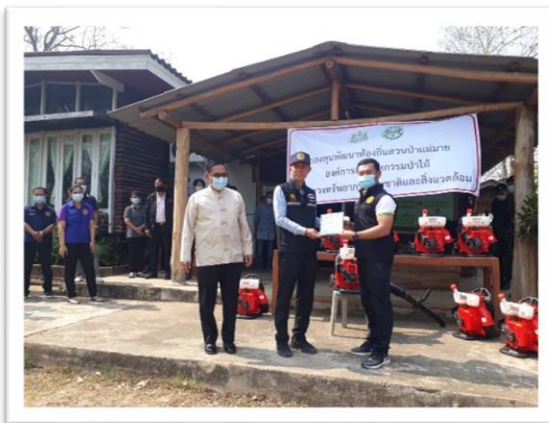
การป้องกันและควบคุมไฟป่าร่วมกับชุมชนรอบสวนป่า