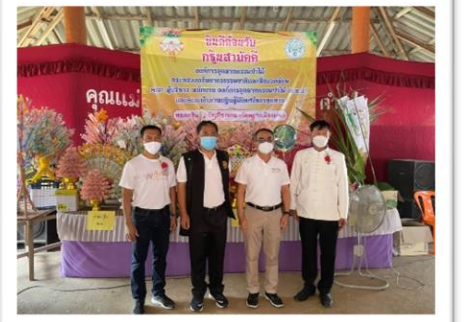
การประชุมร่วมกับผู้นำชุมชนรอบสวนป่า