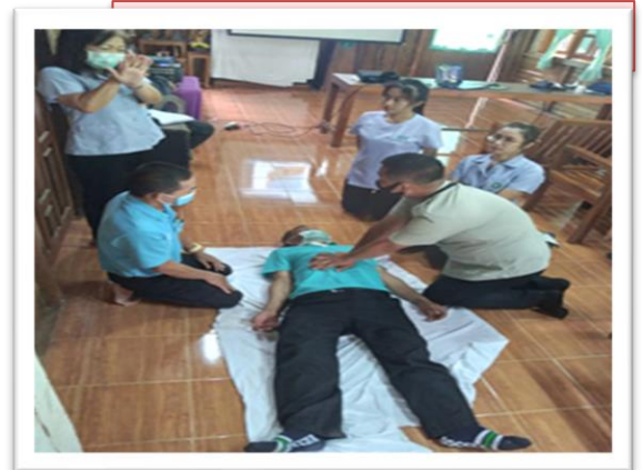
การอบรมปฐมพยาบาลเบื้องต้น