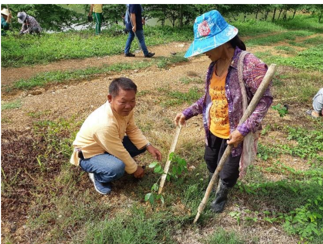
ร่วมกิจกรรม จิตอาสาพระราชทาน ปลูกป่าเนื่องในโอกาสวันแม่แห่งชาติ ณ สวนป่าแม่สรอย ม.14 ต.แม่พุง อ.วังชิ้น จ.แพร่