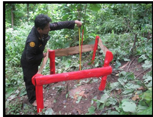
ภาพการตรวจวัดการพังทลายของดิน ในพื้นที่สวนป่าแม่สิน-แม่สูงและนาพูน

* แนวทางการป้องกัน และแก้ไขการพังทลายของดิน อยู่ในหัวข้อการสำรวจผลกระทบทางสิ่งแวดล้อม ซึ่งได้จากการสำรวจด้วยแบบสำรวจ Site Inspection ทั้งก่อนและหลังการทำไม้