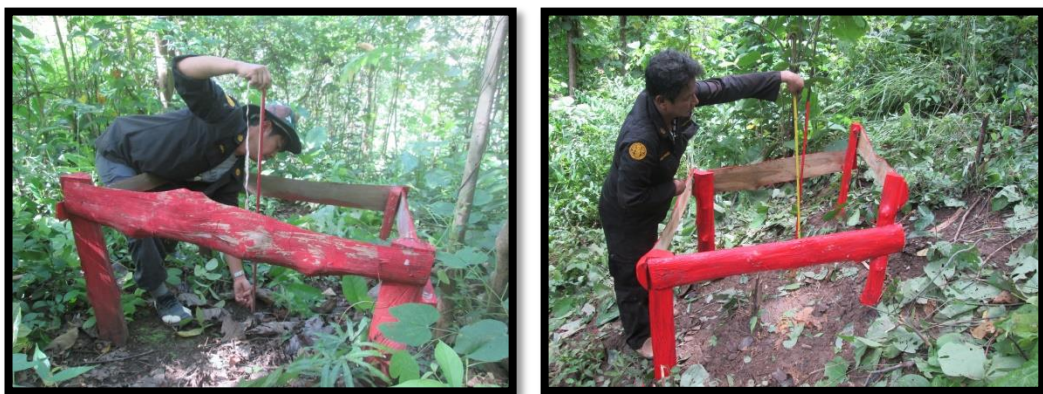
ภาพการตรวจวัดการพังทลายของดิน ในพื้นที่สวนป่าแม่สิน-แม่สูงและนาพูน

จากการตรวจสอบติดตามการพังทลายของดิน ตามสถานีตรวจวัดการพังทลายของดินในพื้นที่สวนป่าแม่สิน-แม่สูง แปลงปี 2534 ,2527 และสวนป่านาพูน แปลงปี 2527 ในการตรวจสอบติดตามพบว่าค่าการพังทลายของดินในพื้นที่ของสวนป่า ฯ อยู่ในระดับที่น้อยมาก ซึ่งไม่ก่อให้เกิดผลกระทบต่อทรัพยากรทางธรรมชาติ และทรัพยากรที่เป็นปัจจัยสำคัญในการดำเนินชีวิตประจำวันของชุมชนรอบพื้นที่สวนป่า เช่น ทรัพยากรน้ำที่ใช้ในการอุปโภค บริโภค เป็นต้น