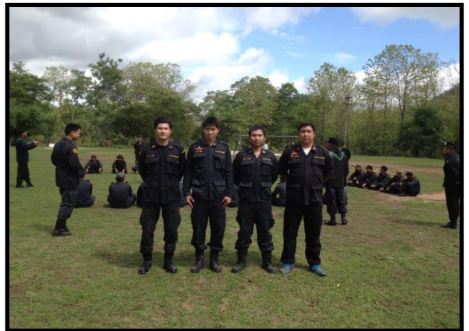
การอบรมการปฏิบัติงานตรวจตราป้องกันการลักลอบตัดไม้ และการบุกกรุกพื้นที่