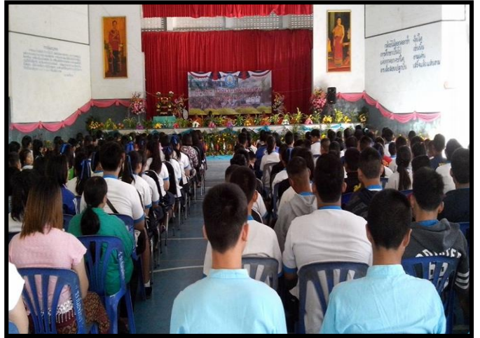
ร่วมงานทำบุญตักบาตร วันสถาปนาโรงเรียนกวีลุมวิทยา ตำบลนิคมพัฒนา