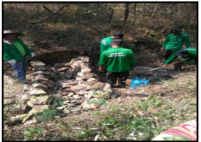
ร่วมกิจกรรมสร้างฝายชะลอน้ำ ณ ห้วยวังถ้ำ ร่วมกับ รทส.ลำปาง