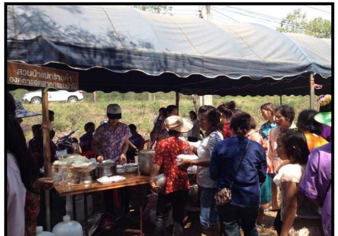
ให้ความร่วมมือในการเข้าร่วมกิจกรรมต่าง ๆ กับหน่วยงานอื่นในท้องที่ตำบลนิคมพัฒนา