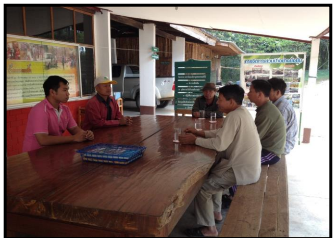
ร่วมประชุม ปรึกษาหารือ ร่วมกับผู้นำชุมชนในพื้นที่รอบ ๆ สวนป่า