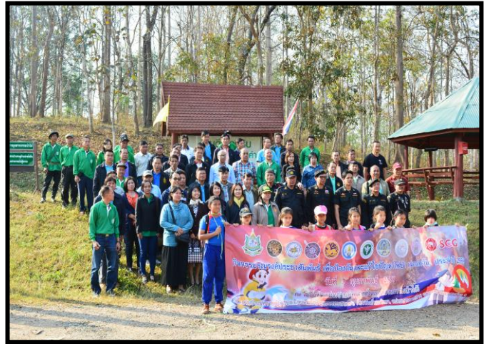
การจัดกิจกรรมรณรงค์ประชาสัมพันธ์ เพื่อป้องกันและแก้ไขปัญหาไฟป่า ณ สำนักงานสวนป่าแม่ทรายคำ