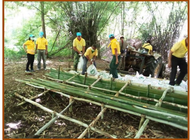
ภาพแนวกันชน (Buffer Zone) และการสร้างฝายดักตะกอนบริเวณลำห้วยที่อยู่ในพื้นที่ทำไม้