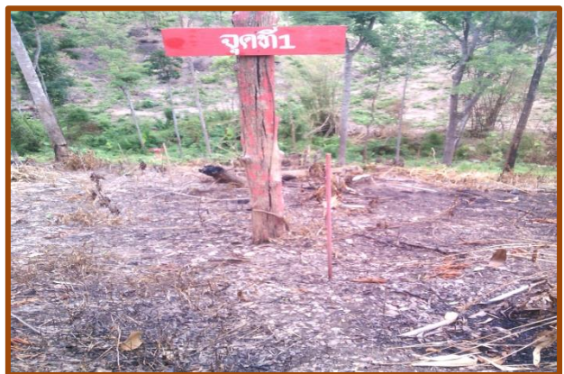
ภาพสถานีตรวจวัดการพังทลายของดินและตรวจวัดการพังทลายของดิน