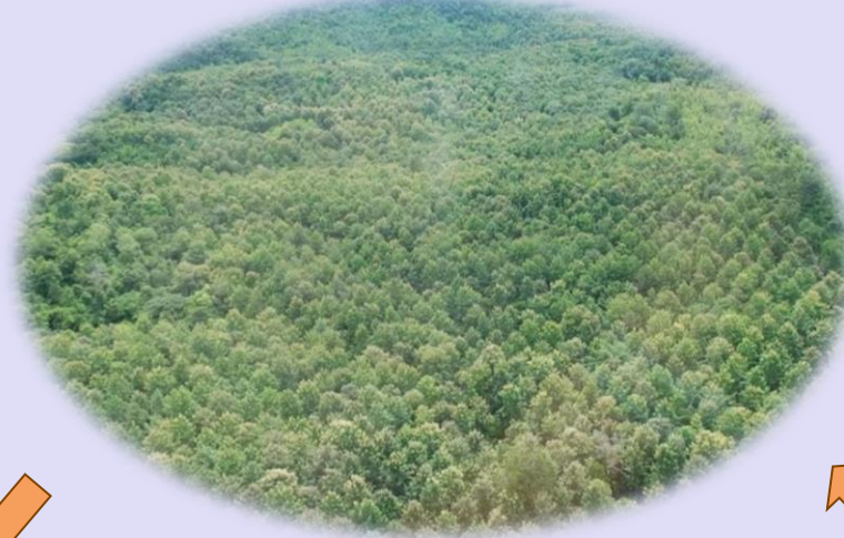
สิ่งแวดล้อม