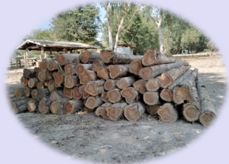
เศรษฐกิจ