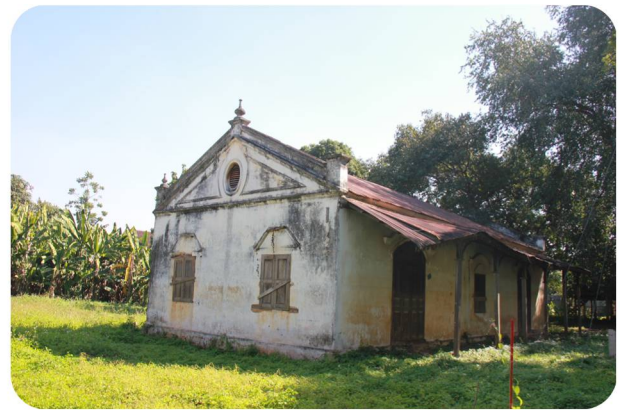
บริษัทหลุยส์ ที่ เลียวโนเวนส์

บ้านหลุยส์ฯ เป็นเรือนไม้โบราณกึ่งปูนทรงปั้นหยาสองชั้น มีกลิ่นอาย โคลเนี่ยล ด้านหน้ามีมุขแปดเหลี่ยม (ยื่นออกมาหกด้าน) ตีเกล็ดไม้ระบายอากาศโปร่งพร้อมบานหน้าต่างมองเห็นได้โดยรอบ ตัวเรือนด้านล่างก่อด้วยปูน ชุ่มประตูดั้งแบบฝรั่งพร้อมช่องระบายอากาศไม้แกะสลักที่ละเอียดสวยงาม ต่อมาเมื่อปี พ.ศ.2482 กรมป่าไม้ รับผิดชอบกิจการ ทำไม้ของบริษัทเบอร์เนียว จำกัด และบริษัทหลุยส์ ที่ เลียว โนเวนส์ มาดำเนินการ ดังนั้น บ้านพัก และบริษัทก็ได้ตกเป็นทรัพย์สินของรัฐในขณะนั้น และปัจจุบันได้อยู่ในความดูแลของ องค์การอุตสาหกรรมป่าไม้ภาคเหนือบน (บริเวณบ้านพักพนักงาน อ.อ.ป.)