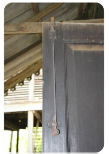
บ้านพักหลุยส์ ที่ เลียวโนเวนส์

บ้านหลุยส์ฯ เป็นเรือนไม้โบราณกึ่งปูนทรงปั้นหยาสองชั้น มีกลิ่นอาย โคลเนี่ยล ด้านหน้ามีมุขแปดเหลี่ยม (ยื่นออกมาหกด้าน) ตีเกล็ดไม้ระบายอากาศโปร่งพร้อมบานหน้าต่างมองเห็นได้โดยรอบ ตัวเรือนด้านล่างก่อด้วยปูน ชุ่มประตูดั้งแบบฝรั่งพร้อมช่องระบายอากาศไม้แกะสลักที่ละเอียดสวยงาม ต่อมาเมื่อปี พ.ศ.2482 กรมป่าไม้ รับผิดชอบกิจการ ทำไม้ของบริษัทเบอร์เนียว จำกัด และบริษัทหลุยส์ ที่ เลียว โนเวนส์ มาดำเนินการ ดังนั้น บ้านพัก และบริษัทก็ได้ตกเป็นทรัพย์สินของรัฐในขณะนั้น และปัจจุบันได้อยู่ในความดูแลของ องค์การอุตสาหกรรมป่าไม้ภาคเหนือบน (บริเวณบ้านพักพนักงาน อ.อ.ป.)